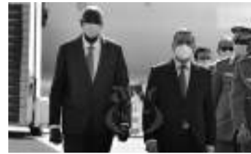
de la République.

Cette visite permettra de "passer en revue les relations bilatérales fraternelles unissant l'Algérie et le Mali, ainsi que les voies et moyens de les développer au mieux des intérêts communs des deux pays", avait indiqué un communiqué de la Présidence