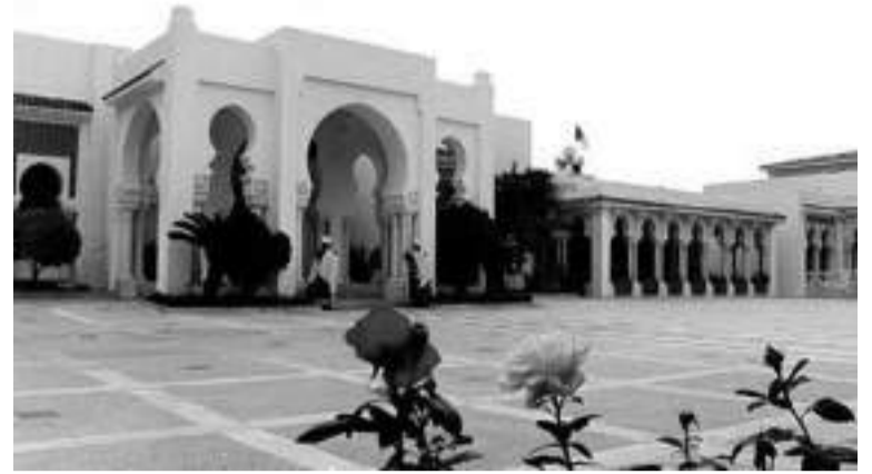
Mosquée d'Alger", lit-on dans le communiqué de la Grande Présidence.

L e Président de la République, chef suprême des Forces Armées, ministre de la Défense nationale, M. Abdelmadjid Tebboune présidera, dimanche, une réunion du Conseil des ministres, indique samedi un communiqué de la Présidence de la République.