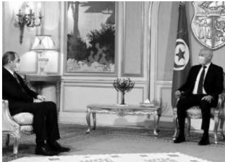
M. Abdelmadjid Tebboune.

Cette déclaration, rapportée par la présidence tunisienne, est intervenue à l'issue de la rencontre entre le président de la République Tunisienne, Kaïs Saïed et le ministre des affaires étrangères, M. Boukadoum qui lui a transmis un message oral du président de la République,