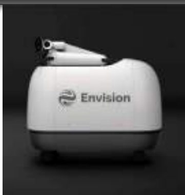
Une recharge se fait en deux heures

Dévoilé lors de la journée zéro carbone de la société à Shanghai, cet appareil devient le premier robot de recharge intelligente mobile produit en série et alimenté à 100% par de l'électricité verte, d'après la société chinoise. Le robot compact sera disponible dans le commerce à partir de juin, date à laquelle les conducteurs de voitures électriques pourront également réserver des services de recharge à l'aide de l'application Mochi.