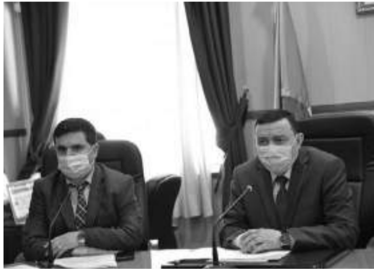
wilayas sur les mouvements de contestations marquant récemment le secteur, le ministre de l'Education

La même source précise que "Lors d'une conférence tenue par visioconférence avec les directeurs de l'éducation des