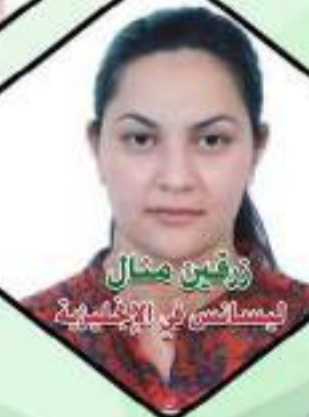
زوين مونا ميساتر في الإنشائية عنابة