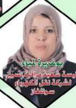
بوعزير بن بيا رئيسة شركة برافعة بتسيير الشركة نقل الكهرباء عنابة