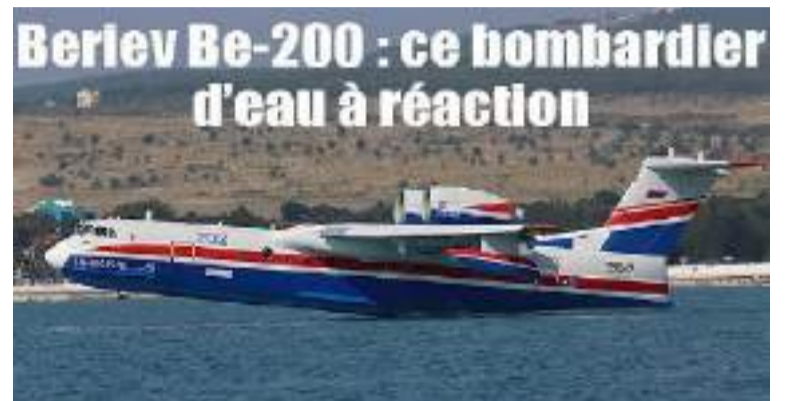
Beriev Be-200 : ce bombardier d'eau à réaction

Le montant de ce marché s'élève à plus de 320 millions de dollars à raison de 40 millions de dollars l'unité.