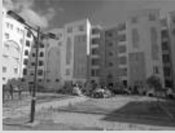
à la cité des "60 logements" du 1er Mai et la cité Kheraza.

Une opération de recasement de 129 familles a été entamée, hier, à El Bouni, a-t-on appris hier. Dans le cadre de cette opération, il a été procédé au relogement de 129 familles résidant à El Bouni dans des logements sociaux de qualité