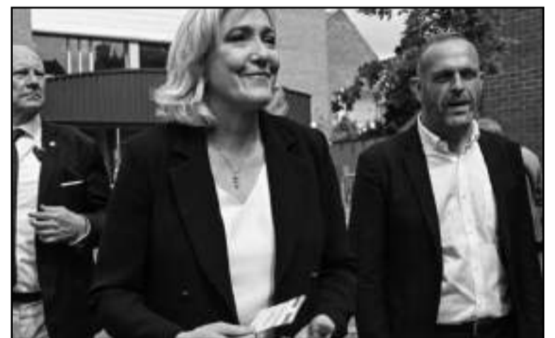
Éric Zemmour, un caillou dans la chaussure

M arine Le Pen entre en campagne. La présidente du Rassemblement national donne le coup d'envoi de sa troisième bataille pour l'Élysée ce dimanche 12 septembre à Fréjus, dans le sud de la France. Elle va laisser officiellement les rênes du parti pour se consacrer à 100% à sa campagne. Marine Le Pen la veut « positive ». Une campagne bienveillante, sans coups bas, concentrée sur ses propositions, et non sur ses adversaires. Voilà le plan de Marine Le Pen pour son troisième essai : la positive attitude. La présidente du RN veut lever le voile sur sa personnalité, faire découvrir sa face cachée aux Français. On la voit déjà sourire sur son affiche. On la verra aussi beaucoup sur le terrain.