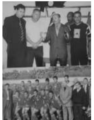
le 1er novembre avec mérite .Allah yarham nos vaillants Chouhada.

responsabilité de chacun de nous tous est engagée car travailler ensemble c'est augmenter les chances de réussite. "Seul je vais plus vite ,ensemble on va plus loin".....On doit s'engager pour apporter une pierre à la construction collective et non pour préserver sa carrière et s'enrichir. Ornonos nos maisons de l'emblème national et fêtons