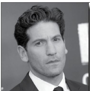
Les acteurs américains Michael Rooker et Jon Bernthal sont