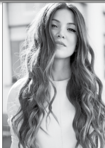
La coloration chocolat cendré

A mi-chemin entre le brun et le roux, le chocolat auburn est une coloration chocolat qui tire vers l'orangé du roux. Par ses reflets chauds, cette nuance donne bonne mine et convient parfaitement aux femmes ayant une crinière naturellement rousse qui souhaitent twister leur couleur de cheveux.