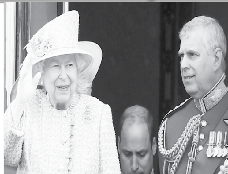
Un chèque de 14 millions d'euros

En 2019, le duc d'York, troisième enfant de la reine Elizabeth II et du prince Philip, avait lui-même creusé sa tombe lors d'un entretien accordé à la BBC, dans lequel il s'était très maladroitement défendu, avançant des arguments particulièrement saugrenus. Dans la foulée, le prince Andrew avait annoncé son retrait de la vie publique, pour ne pas entacher davantage l'image de la Couronne. Peu avant l'anniversaire des 70 ans de règne d'Elizabeth II, le père des princesses Beatrice et Eugénie avait été déchu de ses titres militaires et parrainages royaux par la reine.