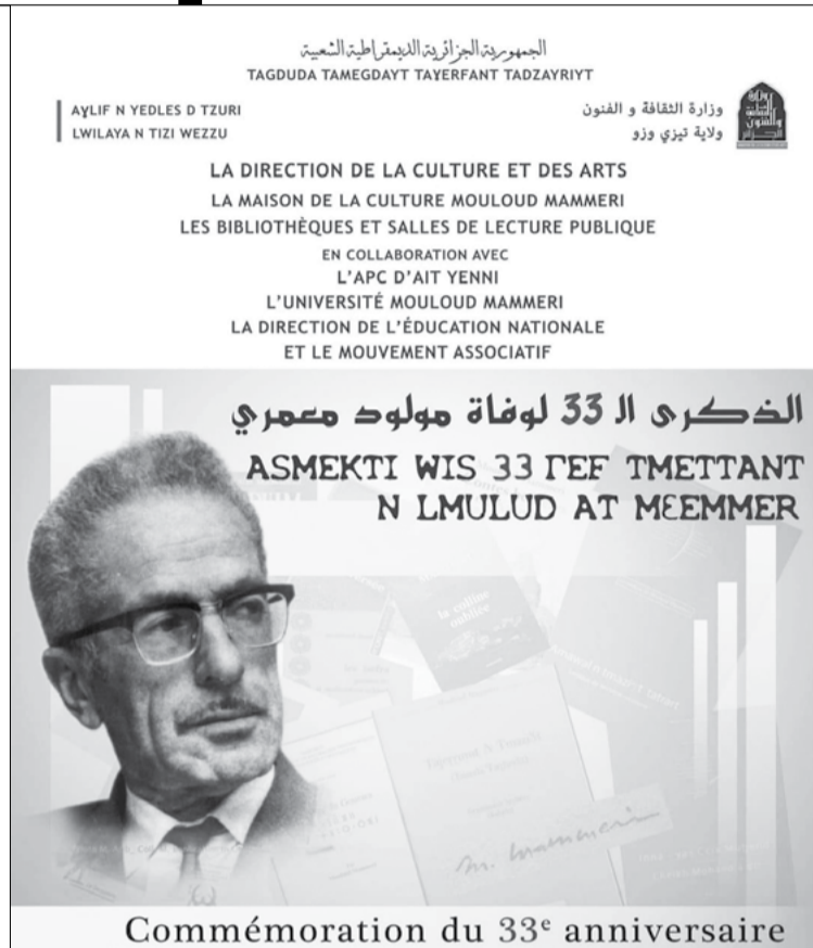
Commémoration du 33 e anniversaire

-Animation d'ateliers de lecture, d'écriture et de dessin au profit des adhérents de la Maison de la