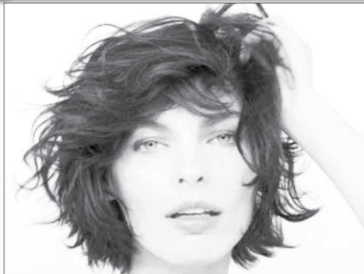
Le carré plongeant mi-long C'est le compromis parfait entre

C'est la solution parfaite pour oser le carré sans trop couper les longueurs. L'effet plongeant apportera du dynamisme à la chevelure et de la modernité au visage. Pour passer au carré plongeant long, il faut que les cheveux arrivent en-dessous des épaules. C'est la