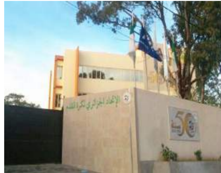
et préparer une mouture finale à présenter lors d'un prochain bureau fédéral, et ce, dans la perspective d'une approbation de l'assemblée générale dans de meilleurs délais.