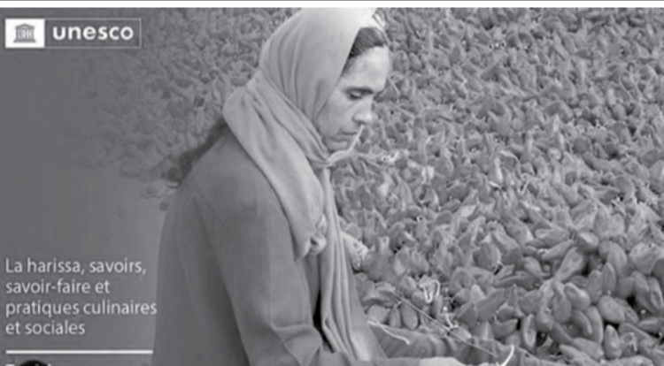
La harissa, savoirs, savoir-faire et pratiques culinaires et sociales

La harissa, condiment national en Tunisie confectionné à base de piments, a été inscrite jeudi par l'UNESCO au patrimoine immatériel de l'humanité.