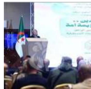
l'ouverture du colloque.

Des cadres de l'Etat et des membres du gouvernement, ainsi que des parlementaires, des moudjahidine, des chercheurs et des historiens, ont pris part à