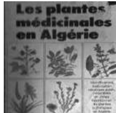
le recours à la médecine est incontournable, même obligatoire. La phytothérapie est généreuse, humaine mais elle ne vaut pas obligatoirement la science », soutient-il.

multiples raisons, impuissante à guérir le mal dont elles souffrent, prix onéreux des médicaments dont certains ne sont plus remboursables et enfin cherté des prestations médicales. A noter que la phytothérapie complète, le médicament mais ne le remplace pas. Certains habitués de ces commerces appellent en renfort la tradition des ancêtres, qui auraient vécu «en bonne santé» sans l'apport de la science. Selon notre interlocuteur « Il faut toujours avoir l'avis de son médecin. Et dans le cas de certaines maladies réticentes,