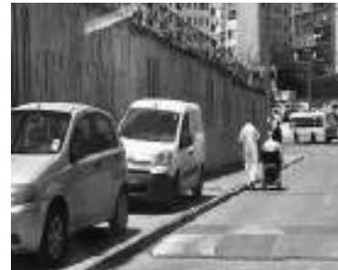
décharger leurs marchandises, entravant ainsi les déplacements des piétons.

pour les piétons qui empruntent les trottoirs et qui se voient contraints de se déplacer sur la chaussée au risque de se faire heurter par des véhicules. On a remarqué que des véhicules et même des camions n'hésitent pas à squatter les trottoirs et même des conducteurs entraînent de diriger leurs camionnettes sur les trottoirs jusqu'à proximité de leurs locaux commerciaux pour