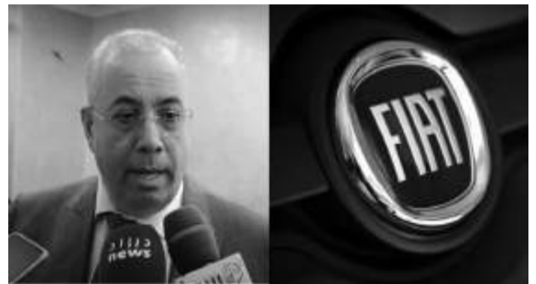
En vertu de cet accord, les voitures de marque Fiat en parties conviennent de coopérer Algérie, en mettant en place étroitement afin de promouvoir des processus de fabrication efficaces les activités de production de

commercialisation des premières voitures Fiat assemblées à l'usine d'Oran débutera fin 2023. Pour rappel, le ministère de l'Industrie algérien et le groupe « Stellantis » ont conclu un accord important le 13 octobre 2022, qui vise à développer les activités de construction automobile ainsi que les services de pièces détachées et d'après-vente pour la marque « Fiat ». Cette convention-cadre constitue une étape cruciale dans l'expansion de l'industrie automobile en Algérie, qui représente un secteur clé de l'économie nationale.