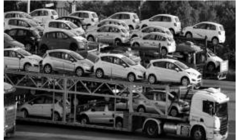
Concernant l'usine "Fiat" travaux "avancent à un rythme relevant du Groupe Stellantis à Oran, le ministre a affirmé que les travaux "avancent à un rythme accéléré sous le suivi minutieux des autorités compétentes".

neufs stipule que "l'investisseur postulant est soumis à l'obtention d'une autorisation préalable lui permettant d'accomplir les démarches pour la réalisation de son investissement. L'autorisation ne constitue pas une autorisation d'exercice effectif de l'activité". Selon l'article 7 du même texte "la durée de validité de l'autorisation préalable est fixée à douze (12) mois. Des commissions de wilaya inspecteront les infrastructures pour vérifier leur conformité au cahier des charges avant l'octroi de l'agrément final.