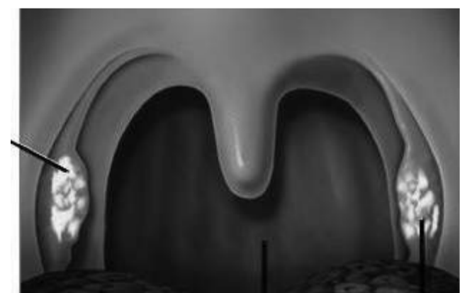
Gorge enflée et douloureuse Amygdale

Ce qui ne manque pas de générer des troubles aux consommateurs fragiles et aux enfants, difficiles à surveiller. Bien que son apparition demeure minime par rapport aux pharyngites, insulations, coups de chaleur et gastro-entérites, les « bobos » les