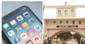
L'application « Tarikh el Djazair » lancée le 5 juillet prochain

Le ministre des Moudjahidines et des droits des citoyens, Laid Rebika, a annoncé aujourd'hui, jeudi, le lancement de la nouvelle application informative « Tarikh el Djazair » sur mobile. Un projet visant à renforcer les liens de communication entre les générations et à faciliter l'accès à l'histoire aux jeunes, plus enclins à utiliser la technologie.