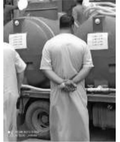
se procurer de l'eau auprès de sources fiables.

La consommation d'eau de source de provenance inconnue est une pratique dangereuse qui peut avoir des conséquences graves sur la santé. Il est important d'éviter de consommer cette eau et de