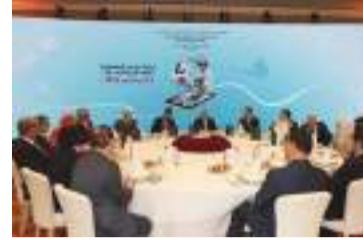
Presse Service (APS).