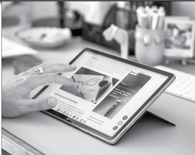
Galaxy A24 et Galaxy A34.

Le mois dernier, nous découvrons que pas moins de cinquante appareils Samsung Galaxy profiteraient de la mise à jour vers One UI 6.0 d'ici février 2024. Depuis, quelques dispositifs se sont ajoutés à cette longue liste, dont les