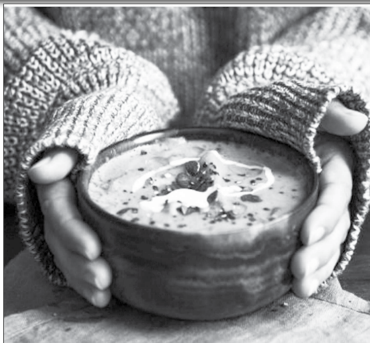
soupe trop liquide

En réalité, c'est assez simple d'éviter que votre soupe préférée