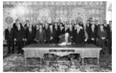
en présence de hauts responsables de l'Etat, selon le communiqué.

La signature a eu lieu au siège de la Présidence de la République,