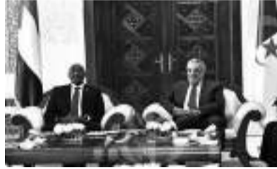
en qualité de représentant du président de la République, M. Abdelmadjid Tebboune.

A son arrivée à l'aéroport international Houari Boumediene, le général Abdel Fattah al-Burhan a été accueilli par le Premier ministre, M. Nadir Larbaoui,