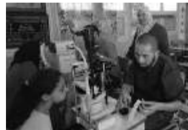
les élèves à des pratiques saines. Des ateliers éducatifs ont abordé des thèmes tels que l'alimentation équilibrée, l'importance de l'activité physique et les bonnes habitudes de sommeil.

Parallèlement, les dentistes ont dispensé des conseils sur l'hygiène bucco-dentaire et réalisé des examens dentaires approfondis. L'attention portée à la santé dentaire contribue non seulement au bien-être physique. Au-delà des consultations individuelles, la caravane médicale a également eu l'occasion de sensibiliser