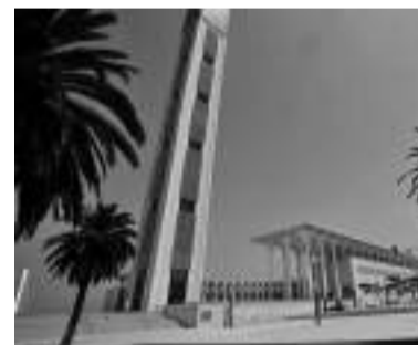
l'inauguration officielle de Djamaâ El-Djazaïr et de l'ensemble de ses infrastructures.

Pour rappel, le président de la République, M. Abdelmadjid Tebboune, avait présidé, dimanche dernier,