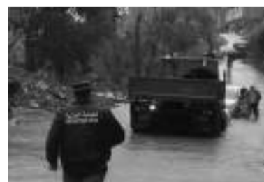
à la circulation, suite à l'amoncellement de la neige et au cumul des eaux pluviales.

Concernant le trafic routier, les services de la Protection civile soulignent que des opérations de déneigement sont menées pour la réouverture des axes routiers coupés ou difficiles