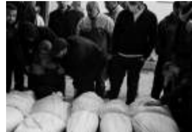
retour n'a rien qui soit choquant du point de vue humain.

avait procuré l'immunité qui l'autorise à bafouer les règles des droits. En tout cas, ce qui se passe aujourd'hui à Gaza et au moyen orient est un étrange destin avec les menaces aveugles d'Israël contre les civils dans toute la région. On peut dans ces conditions affirmées que la loi du droit au