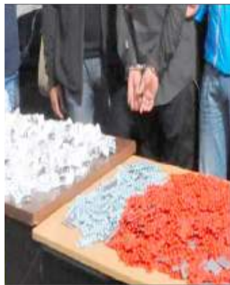
vente illégale de psychotropes.

Dans la continuité des activités des unités opérationnelles de la Sûreté d'Annaba, pour lutter contre le fléau des drogues et psychotropes, la Brigade Antistupéfiants de la Sûreté d'Annaba a pu, la semaine dernière se saisir de 2.608 comprimés psychotropes de type Prégabaline 300 mg d'importation, en plus d'un véhicule utilisé pour le transport des substances psychotropes et procédé à l'arrestation d'un individu âgé de 36 ans. Après avoir accompli toutes les formalités judiciaires nécessaires, le suspect a été présenté, le avant-hier, par devant le Procureur de la République près le tribunal d'Annaba, dans l'affaire de détention, stockage, et la