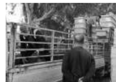
l'environnement et l'économie locale.

pour l'année 2024, en attendant la distribution des colonies d'abeilles dans les jours à venir en vue de compléter le soutien à tous les apiculteurs de la wilaya. Cette initiative vise à stimuler le secteur apicole et à encourager davantage de personnes à s'engager dans cette activité bénéfique pour