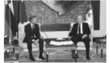
de l'Energie et des Mines, M. Mohamed Arkab

L e président de la République, M. Abdelmadjid Tebboune, s'est entretenu, lundi au siège de la présidence de la République, avec le Premier ministre de la République de Slovaquie, M. Robert Golob, qui effectuait une visite officielle en Algérie.