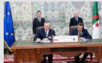
général de la compagnie slovène. En outre, un mémorandum d'entente