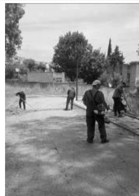
un environnement de soins optimal.

Afin d'assurer un environnement sain aux patients et personnel médical, une campagne de nettoyage a été observée, hier, à l'extérieur de l'hôpital psychiatrique aboubaker Razi, initiée par la direction générale du centre hospitalier d'Annaba. Cette initiative a pour objectif d'éliminer les déchets à l'extérieur de l'établissement notamment l'enlèvement des herbes sèches en prévision de lutte contre les feux de forêts. En effet, les agents de nettoyage de l'hôpital ont déployés tous les moyens afin de mener à bien cette opération. La direction générale a entrepris ces mesures décisives pour faire face à cette situation. Consciente des risques d'incendie, la rigueur et l'efficacité ont été de mise dans l'élimination des déchets dans le but de préserver la santé publique et de garantir