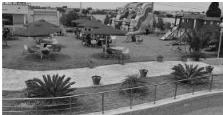
afin de se pencher sur leurs préoccupations et trouver une solution à leur calvaire dans les meilleurs délais.

à occuper des placettes de parking dans l'enceinte des cités servant à des parties de football. Pourtant les règles de l'urbanisme sont claires. Une cité doit impérativement fournir aux enfants les moyens de développer cette énergie latente qui est en eux. Ce qui a amené les habitants à étaler leur ras-le-bol. Ces derniers exigent une intervention urgente des autorités locales