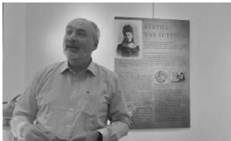
anges en vert" qui retrace la lutte pour la paix de Bertha Von Suttner Kinsky (1843-1914), secrétaire privée d'Alfred Nobel et auteur du roman pacifiste

C'est justement dans le cadre de la coopération culturelle qu'a été initiée l'exposition "Les