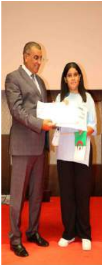
d'apporter ses applaudissements

En effet, lors de ce moment fort, de la remise des distinctions les familles des lauréats sont venues également partager leurs joies face au podium érigé pour la circonstance. La cérémonie inaugurale a été marquée par les chants culturels patriotiques et mouvements artistiques menés par des troupes de jeunes drapés d'habits aux couleurs nationales pour l'amour de la patrie sous les regards d'une salle comble qui n'a pas manqué