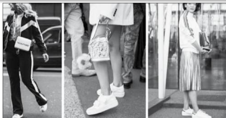
Les chaussures XXL pour allier style et confort

Tendances mode femme : quelles paires de baskets blanches porter à la rentrée ?