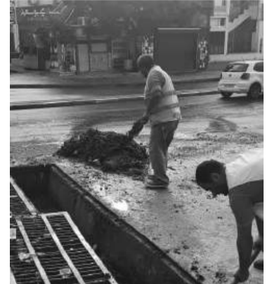
qui se poursuit, selon les informations recueillies.

d'assainissement et leur renouvellement. Ces équipes ont pour mission la prise en charge des opérations de curage des avaloirs et des regards de la commune. Cette opération vise, en premier lieu, les avaloirs qui ont été obstrués par toutes sortes de débris (terre, boue, pierres, sachets en plastique...). Tous les moyens humains et matériels seront mobilisés par les instances concernées, afin d'assurer le bon déroulement de ce programme