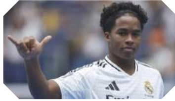
Un but pour sa première en C1

Pour le meilleur et pour le pire, le Real Madrid et Endrick se sont dit oui le 15 décembre 2022. Acheté pour 70 millions d'euros (bonus compris), le jeune crack auriverde a été envoyé en prêt à Palmeiras, le temps qu'il atteigne sa majorité. Ce qui est le cas depuis le 21 juillet. Il s'est alors envolé vers la capitale espagnole pour aller vivre son rêve. Présent lors de la tournée estivale aux Etats-Unis, l'attaquant n'a pas forcément été à son avantage. Ses premiers pas ont même été jugés inquiétants par les médias ibériques. Mais le footballeur né en 2006 s'est accroché, lui qui sait qu'il n'aura pas un rôle majeur à jouer dans les premiers temps.