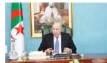
de sa campagne électorale pour la Présidentielle du 7 septembre 2024", a précisé le communiqué.

L e Président de la République, M. Abdelmadjid Tebboune a présidé, jeudi, une réunion préparatoire consacrée aux