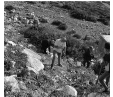
déchets domestiques ainsi que les déchets jetés un peu partout.

ayant préalablement nécessité le recensement des points noirs, les services communaux appellent à la nécessaire adhésion des citoyens et à leur contribution dans cet effort collectif qui concerne la collectivité, visant à créer un environnement sain et un cadre de vie embelli à Annaba. Les opérations de nettoyage ont permis de ramassage d'importantes quantités de