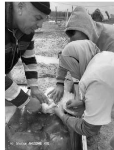
d'optimiser l'efficacité des interventions préventives.