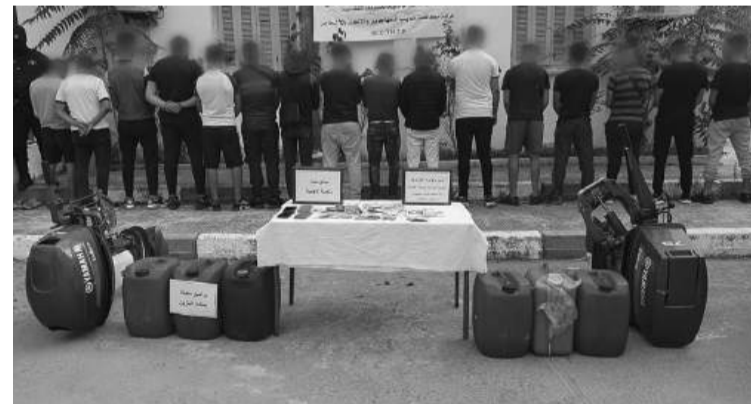
contrôle médical avant d'être présentés, devant le magistrat instructeur près le tribunal de la wilaya.

Ces harragas étaient à bord de deux embarcations dotées d'un moteur de 75 chevaux et de 40 chevaux. Ainsi, la police judiciaire a saisi à bord des embarcations six (6) bidons d'essence ainsi que des sommes importantes d'argent d'une monnaie étrangère selon la même source. Les 17 mis en cause ont été reconduits sur la terre ferme, les passagers clandestins ont été soumis aux formalités d'usage et à un