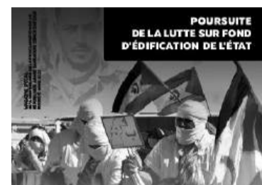
POURSUITE DE LA LUTTE SUR FOND D'ÉDIFICATION DE L'ÉTAT

Dans une lettre adressée au roi du Maroc en juillet, le président français Emmanuel Macron avait affirmé considérer que "le présent et l'avenir du Sahara occidental s'inscrivent dans le cadre de la souveraineté