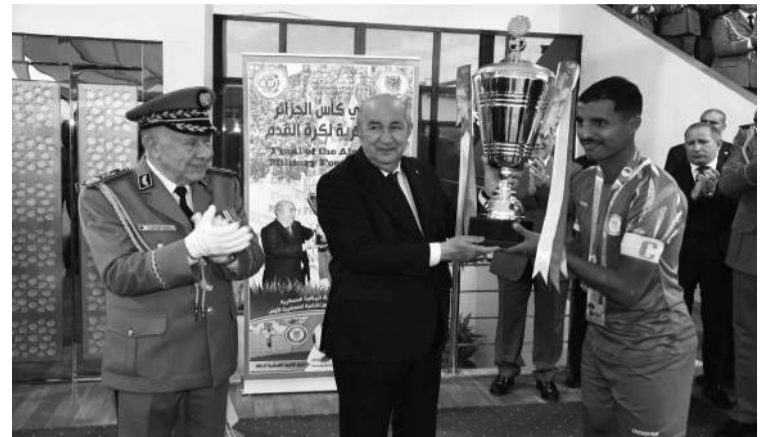
Le président de la République, le Commandant de la 1 ère Région militaire, le chef de l'Etat-major de l'ANP, ainsi que le chef du service des sports militaires.

Chanegriha, Chef d'Etat-major de l'Armée nationale populaire (ANP). Après avoir écouté l'hymne national, les honneurs ont été rendus au président de la République par les formations des différentes forces militaires de l'ANP. Le président de la République a salué le Général d'Armée Commandant de la Garde républicaine, le Secrétaire général du ministère de la Défense nationale, les Commandants des Forces armées et de la Gendarmerie