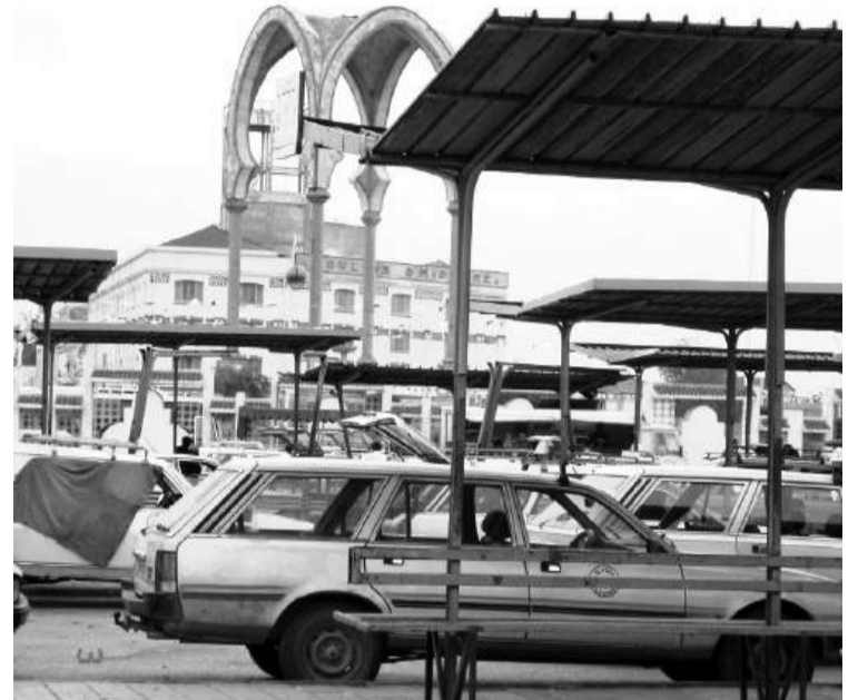
besoins fondamentaux des citoyens et par l'application de solutions concrètes adaptées aux réalités locales.

Cette demande, bien que d'apparence modeste, met en exergue des enjeux plus vastes liés à la réhabilitation et à la modernisation des infrastructures publiques. Le développement urbain durable passe inéluctablement par la prise en compte des