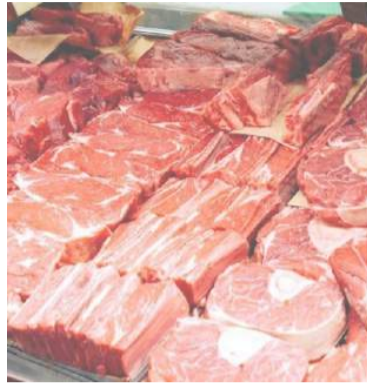
Viande rouge : Alviar annonce la réception d'une nouvelle cargaison en provenance du Brésil

Les aliments destinés à l'engraissement sont encore plus chers, avec des prix oscillant entre 6000 et 7000 dinars le quintal. Belkacem Mezroua a exprimé son mécontentement face à cette situation, rappelant que près de 200 000 éleveurs sont titulaires d'une carte d'éleveur.