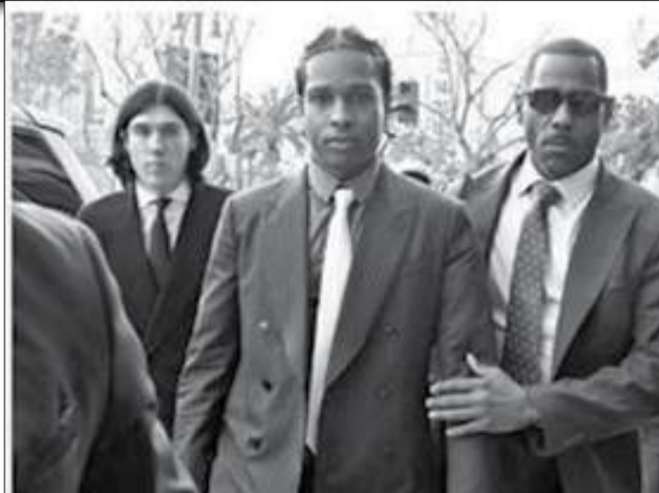
Au cours du procès, ouvert fin janvier, l'accusation a accusé

Le rappeur américain A$AP Rocky a été relaxé par un tribunal de Los Angeles dans son procès pour agression avec une arme semi-automatique, mardi 19 février. Né Rakim Mayers, l'artiste de 36 ans, qui a deux enfants avec la chanteuse Rihanna, comparait pour avoir tiré sur un ancien ami en novembre 2021 en plein Hollywood. Il encourait plus de vingt ans de prison.