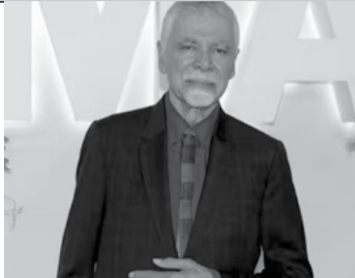
Ricardo Scofidio a continué de donner une âme à tous les pro-

Le cabinet de Ricardo Scofidio a mené d'autres grands projets à travers le monde, parmi lesquels The Broad, célèbre musée d'art contemporain de Los Angeles et le Zaryadye Park, un parc urbain paysager situé à côté de la Place Rouge de Moscou.