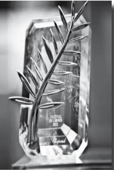
tunisienne Abdellatif Kechiche

synonyme de discours mémorables. Certains réalisateurs lauréats ont marqué l'histoire du festival par leur émotion, leur engagement ou leurs déclarations surprenantes.