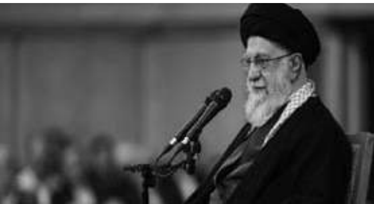
toute tentative de déstabilisation.

fondé sur les annonces officielles et des médias. Devant des fidèles rassemblés à Téhéran à l'occasion d'une fête chiite, l'ayatollah Khamenei a estimé « justes » les revendications économiques des manifestants. « Les autorités du pays le reconnaissent, le président et d'autres responsables de haut rang s'efforcent de résoudre ce problème », a-t-il déclaré. « C'est pourquoi les commerçants ont protesté contre cette situation, et c'est tout à fait juste », a ajouté M. Khamenei, au pouvoir depuis 1989. « Nous dialoguons avec les manifestants (...) mais il est inutile de dialoguer avec les émeutiers. Ces derniers doivent être remis à leur place », a toutefois affirmé le Guide suprême. Depuis le début des protestations, le pouvoir joue à la fois sur l'apaisement, reconnaissant des « revendications légitimes » liées aux difficultés économiques, et sur la fermeté face à