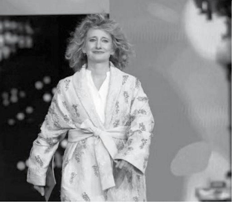
Une déclaration de Wim Wenders a suscité la controverse, provoquant le retrait du festival de la romancière indienne Arundhati Roy. Elle devait présenter une version restaurée d'un film qu'elle a écrit en 1989, «In Which Annie Gives