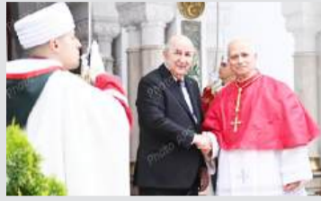
Le Souverain pontife est arrivé peu auparavant à Alger pour une visite officielle

L e président de la République, M. Abdelmadjid Tebboune, a réservé, lundi au siège de la Présidence de la République, un accueil officiel à Sa Sainteté, le Pape Léon XIV. Le président de la République et Sa Sainteté, le Pape Léon XIV ont pris une photo souvenir devant les représentants des médias nationaux et étrangers.