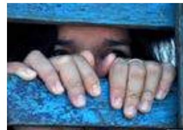
déployées par l'État et les autorités compétentes.

Une gestion interministérielle rigoureuse